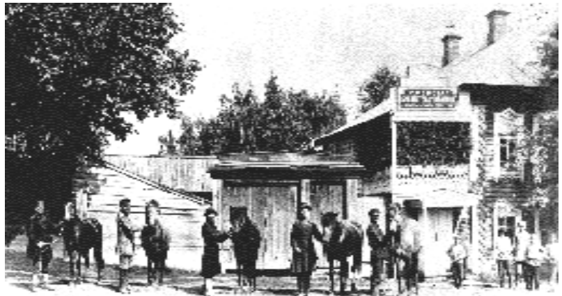
Библиотека-читальня Сарапульского земства.

обуви! Они многое постигали самостоятельно, экспериментировали с природными красителями, стараясь добиться прочной и красивой окраски. Их голубой сафьян шел на обложки альбомов, книг, в него переплетали религиозную литературу, из красного шили мусульманские ичеги, детскую и женскую обувь. Их успехи оценивали грамотами и наградами, дипломами и свидетельствами самых престижных российских ярмарок.