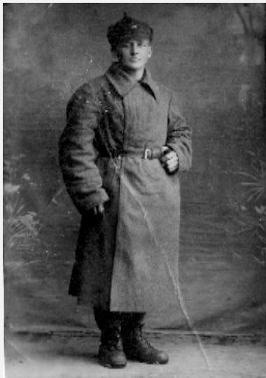
Сапоги для солдат...