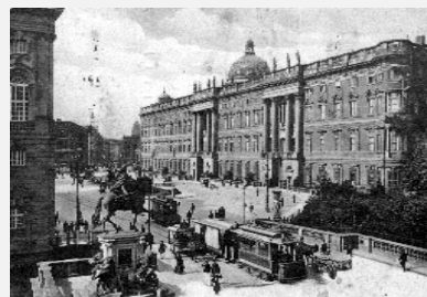
В чем-то Сарапул, возможно, подражал облику немецких городов.