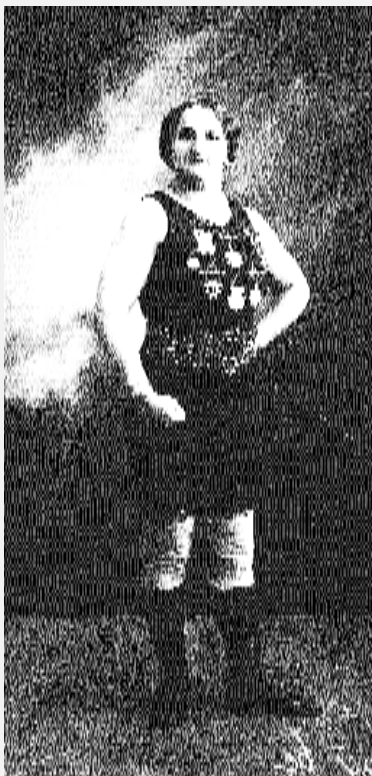
и сапоги для артистов.

поглощающего влагу, получатся неплохие ящики для хранения сырых необработанных кож, которые обычно закупали большими партиями. Чтобы шкуры не прели, не мялись и до обработки не снижали своего качества, их укладывали в ящики в расправленном виде не более пятнадцати штук. Ящики маркировали, ставили друг на друга и хранили в сараях. Этот метод переняли у Барabanщикова все сарапульские фабриканты.