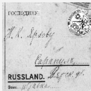
Немецкая почтовая открытка (оборотная сторона изображения).