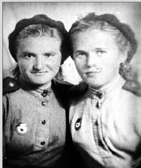
С фронтовой подругой.