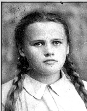
Десятый класс, 1942 год.

— В работу. А во что же еще можно верить? В накопительство, в богатство, во власть? Веры проходят, а работа остается.