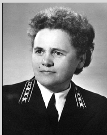
На страже Закона. 1972 г.