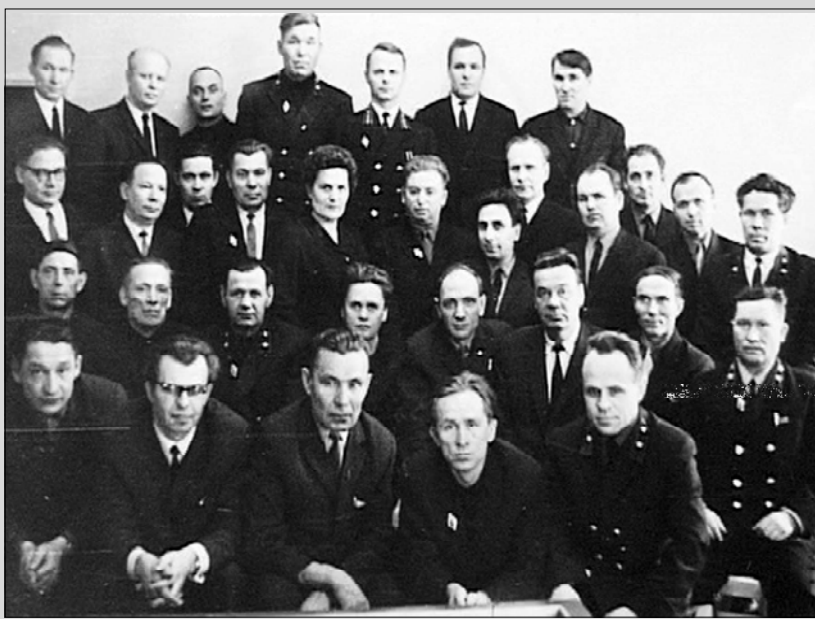
Центральный аппарат прокуратуры в 60 годы.

«Труднее хранить верность той женщине, которая дарит счастье, нежели той, которая мучает».