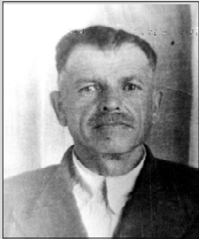
Глава семейства Загуменовых, председатель колхоза, убит врагами большевиков.