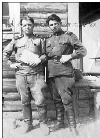
Только что отгуляли на свадьбе.