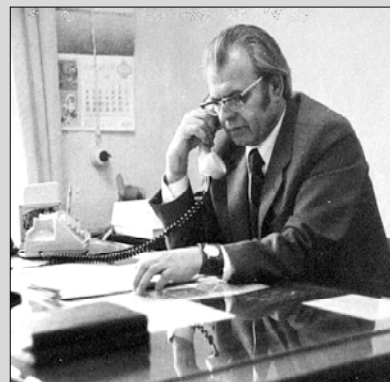
В своем рабочем кабинете.