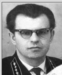
В должности старшего следователя прокуратуры.

«Старики потому так любят давать хорошие советы, что уже не способны подавать плохие примеры».