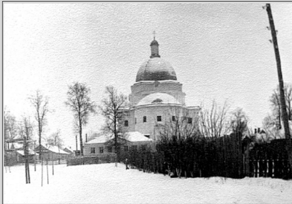
Эта церковь спасала от бомбежек.