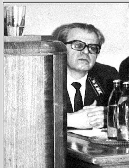
Главной трибуной в жизни была лишь сама Жизнь.