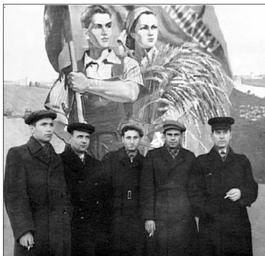
В Саратовском юридическом институте, на работе в колхозе (второй справа).

В отделе кадров молокозавода муж проработал не долго — потом была работа на механическом заводе, затем — инструктором в Пастуховском райкоме партии. Наш быт стал понемногу налаживаться, уже была куплена плита, мебель, маленький диванчик... Когда вечером я засыпала на нем, то муж не будил меня, а тихо брал на руки и уносил на кровать. Если утром он просыпался раньше меня, то никогда не будил: тихонько согреет чаю и уйдет на работу. А когда приходил домой — обязательно поцелует.